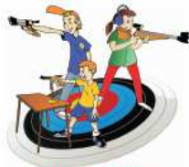
Carabine et Pistolet Ecole de Tir